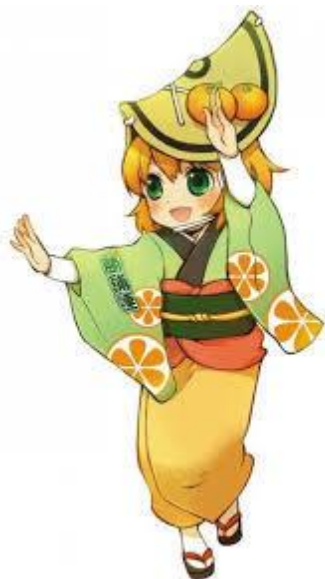
勝浦みかんキャラクター：ちょぞっ娘